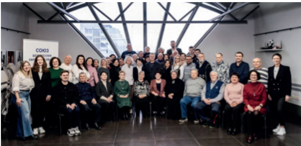
Präsident (Mitte) und Gemeindevertreter an ihrem jährlichen Treffen

Die insgesamt 16 Kleingemeinden (Brest, Baranovichi, Bobruisk, Borisov, Vitebsk, Gomel, Grodno, Kalinkovichi, Lida, Mohilev, Mozhir, Orsha, Pinsk, Rechitsa, Slutsk und Soligorsk) werden jeweils von einer vorsitzenden Person (Chair) geleitet. Rund die Hälfte dieser Gemeinden und ihre Leitungen sind uns persönlich bekannt, da wir während unserer jährlichen Reisen stets auch eine Kleingemeinde besucht und Einblicke in das jeweilige Gemeindeleben erhalten haben. Zudem erhalten wir von UBJOC nahezu monatlich kurze Berichte aus den einzelnen Gemeinden, sodass wir auch ohne physische Präsenz gut informiert bleiben.